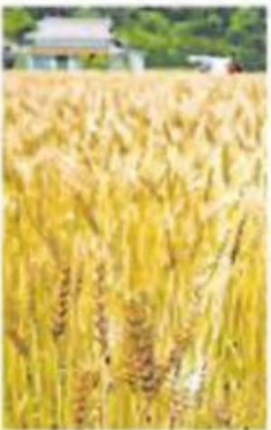
小麦の値段は上がり続けている

高水準まで値上がりしています。昨年の夏に異常な高温・乾燥に見舞われたアメリカで小麦がうまく実らなかったことや、小麦の産地として有名なウクライナにロシアが侵攻し、ウクライナからの輸出が減ったことが原因です。